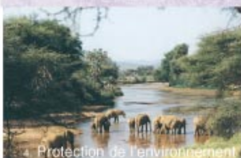
4. Protection de l'environnement