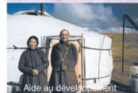
9. Aide au développement