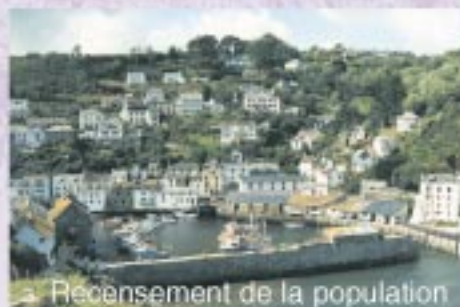
3. Recensement de la population