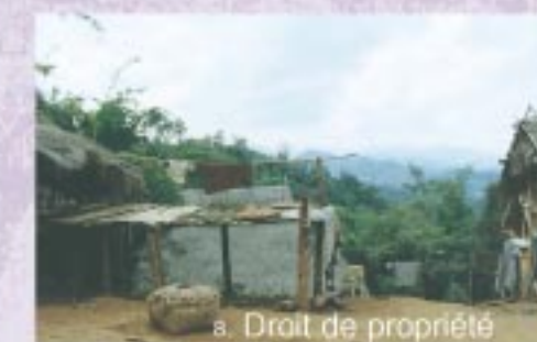
8. Droit de propriété