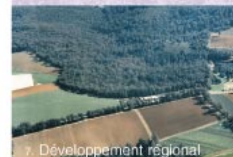
7. Développement régional