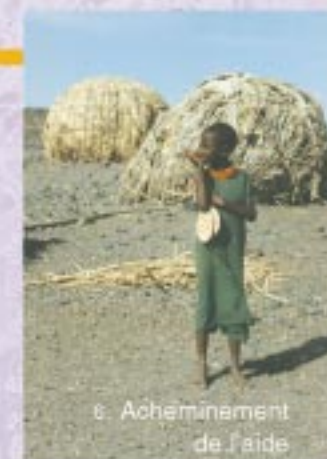
6. Acheminement de l'aide