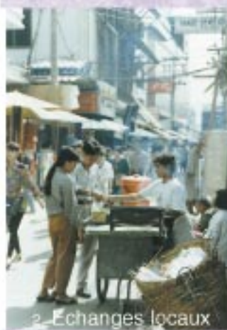
2. Echanges locaux