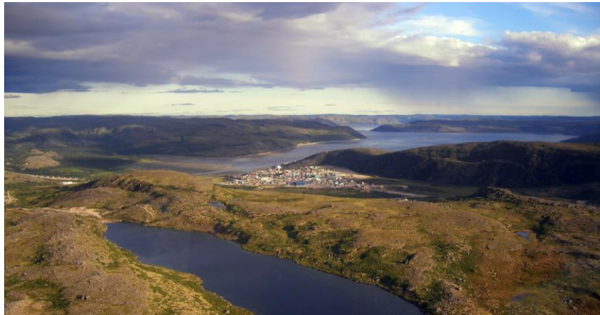
Kangiqsualujuaq, « la très grande baie ». (Commission de toponymie du Québec)

Les écrits nous aident quand même à comprendre l'importance des coutumes, des pratiques ou des traditions des Autochtones selon les époques ainsi que de leurs activités modernes (Champoux, 2012), et même des lignes de communication et d'échanges partout dans le Nord.